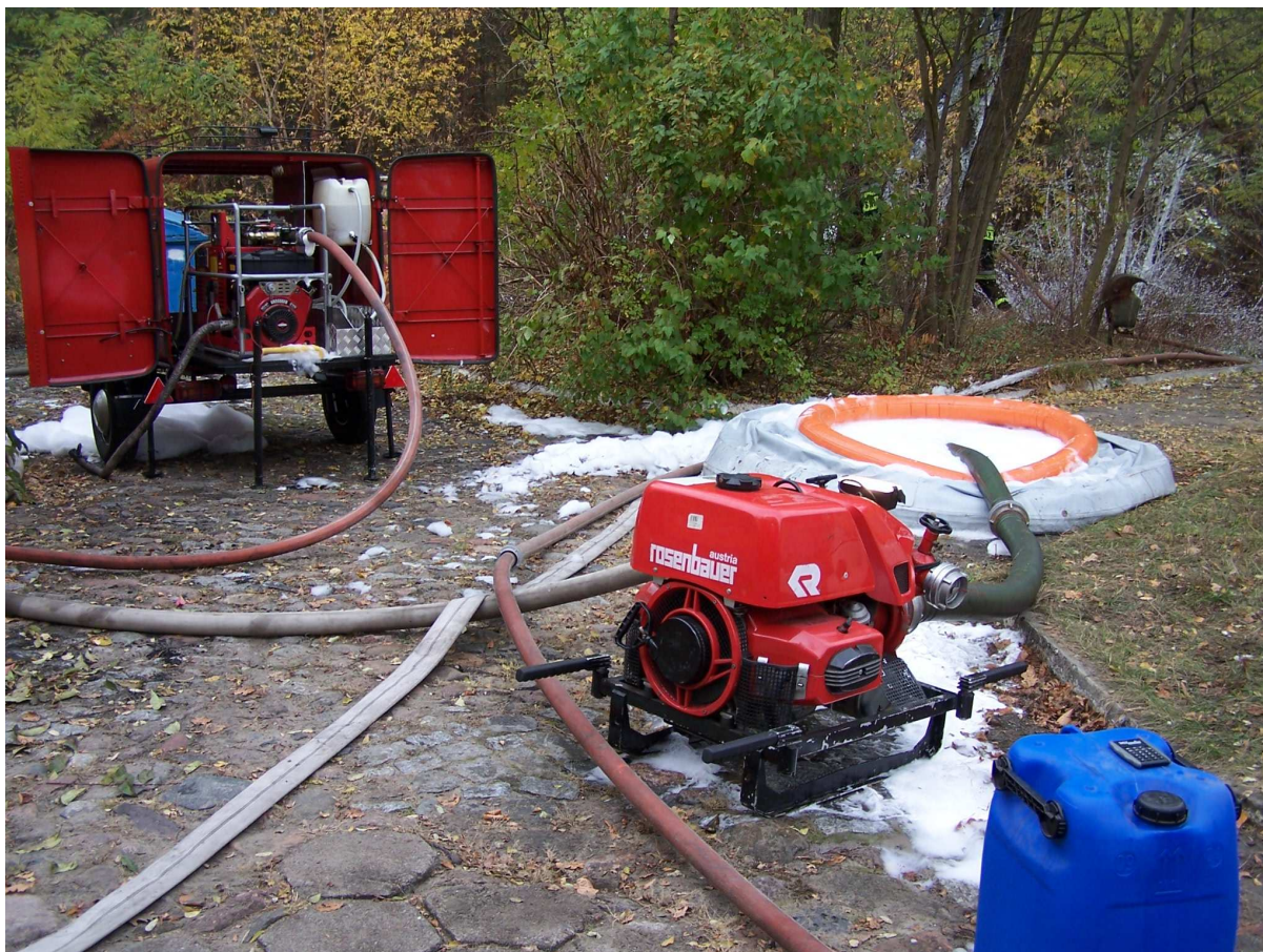
Fot. 3 Widok stanowiska do przeprowadzenia badań