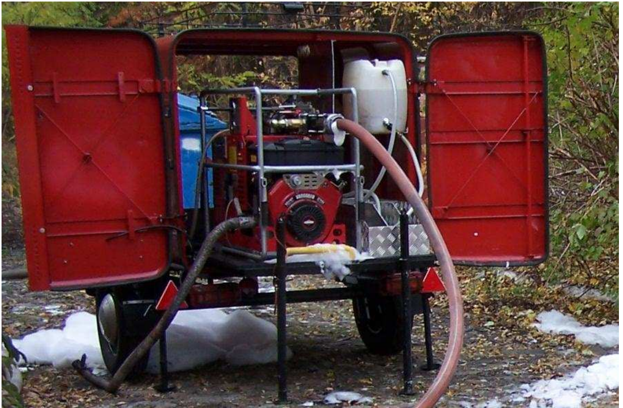
Fot. 2. Urządzenie CAFS zabudowane na przyczepce.