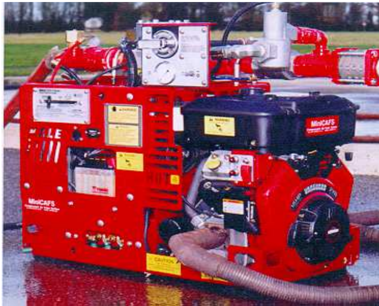
Fot. 1. MINI CAFS firmy HALE